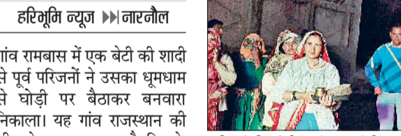
मंडी अटेली। घोड़ी पर बैठाकर बेटी का बनवारा निकालते हुए।

■ 19 फरवरी को राजस्थान के रोहित से होगी शादी