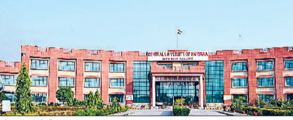
महेन्द्रगढ़। हकेंवि भवन।

■ 300 से अधिक विद्वान, शोधार्थी व शिक्षाविद करेंगे प्रतिभागिता