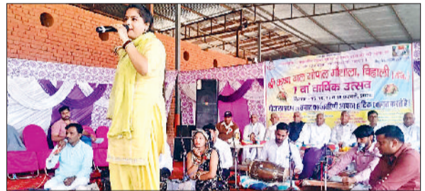
मंडी अटेली। बिहाली गोशाला में रंगारंग प्रस्तुति देते कलाकार।