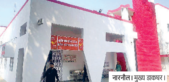
नारनौल। मुख्य डाकघर।

भारतीय डाक विभाग की ओर से यूनिवर्सल पोस्टल यूनिन (यूपीयू) के तत्वावधान में आयोजित होने वाली 55वीं अंतरराष्ट्रीय पत्र लेखन प्रतियोगिता 2026 के लिए प्रविष्टियां आमंत्रित की गई हैं। इस संबंध में जानकारी देते हुए डाक अधीक्षक भिवानी मंडल ने बताया कि इस प्रतियोगिता का मुख्य उद्देश्य युवाओं में पत्र लेखन की कला को जीवित रखना और उनके विचारों को वैश्विक मंच प्रदान करना है। इस वर्ष की प्रतियोगिता का विषय एक मित्र को पत्र लिखें कि डिजिटल दुनिया में मानवीय संपर्क, क्यों मायने