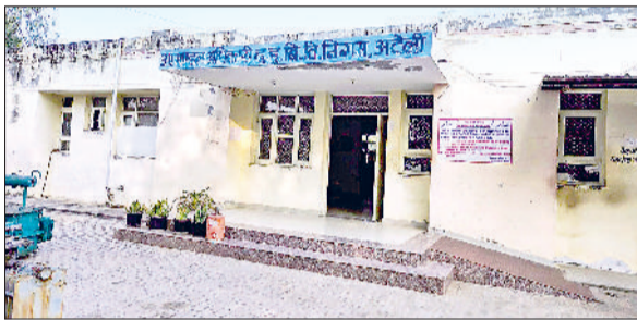
मंडी अटेली। अटेली का उपमंडल स्तर का कार्यालय।