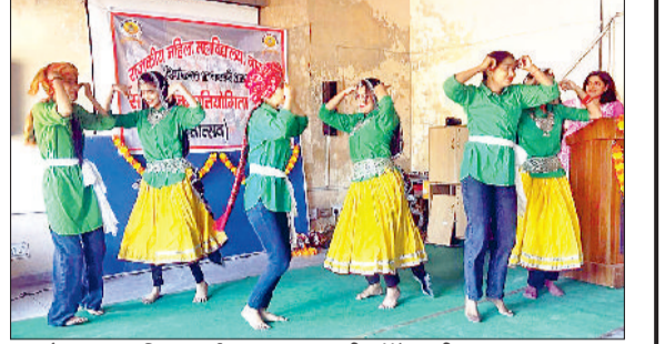
नारनौल। सांस्कृतिक कार्यक्रम प्रस्तुत करती कॉलेज की छात्राएं।