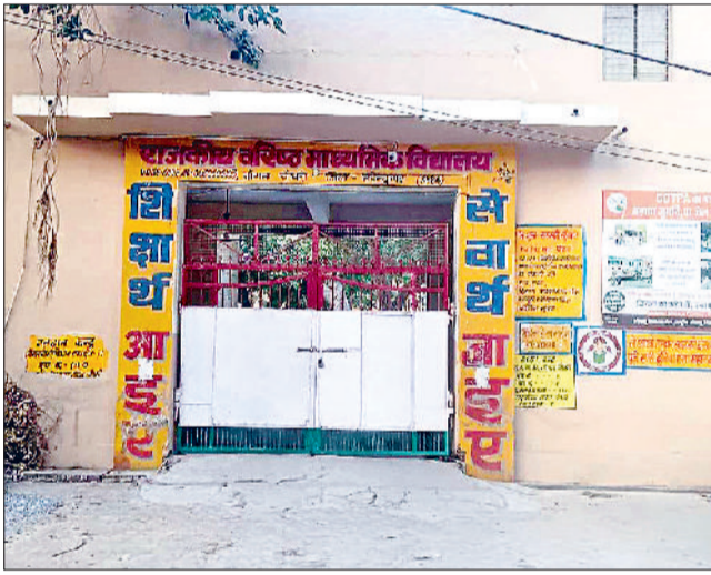
नांगल चौधरी। राजकीय वरिष्ठ विद्यालय।