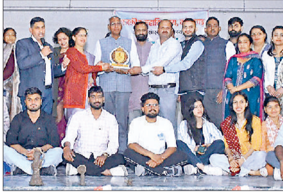
महेन्द्रगढ़। विधायक को सम्मानित करते कॉलेज स्टाफ।

रागिनी में निखिल, हिंदी कविता में राहुल, हरियाणवी कविता में निखिल, हरियाणवी नृत्य में जानवी ने हासिल किया प्रथम स्थान